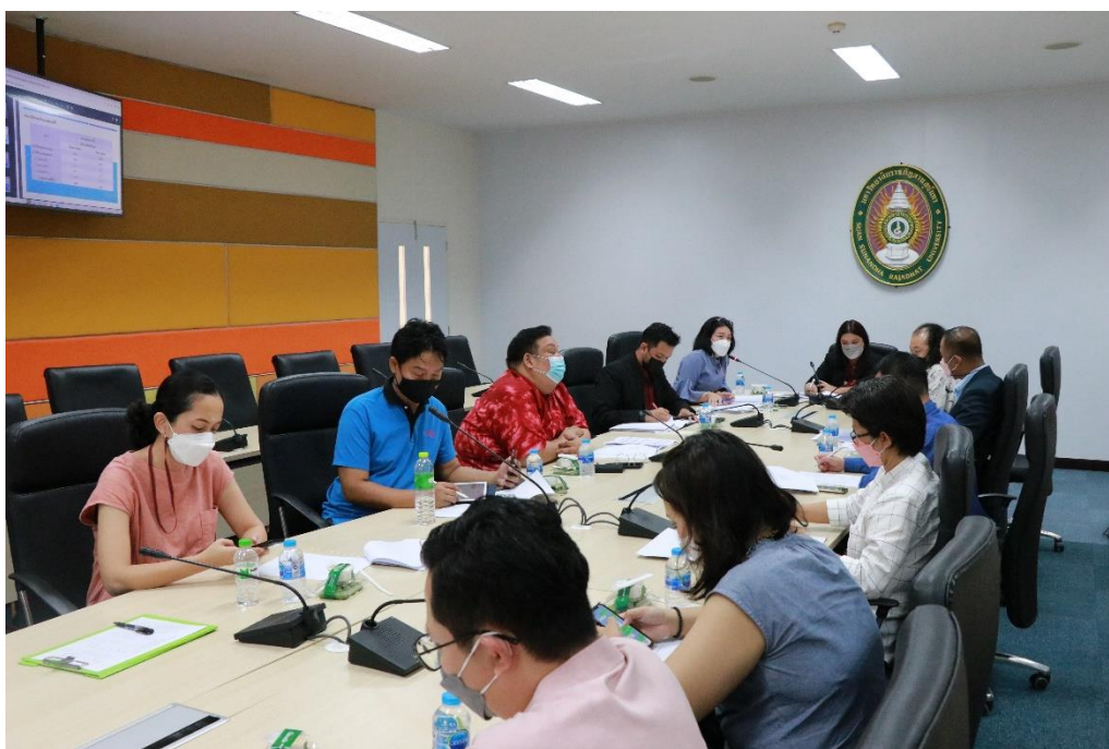
ภาพกิจกรรมการ ระยะเวลาที่ 1

ทบทวนแผน และจัดทำแผนปฏิบัติการประจำปีงบประมาณ พ.ศ. 2566