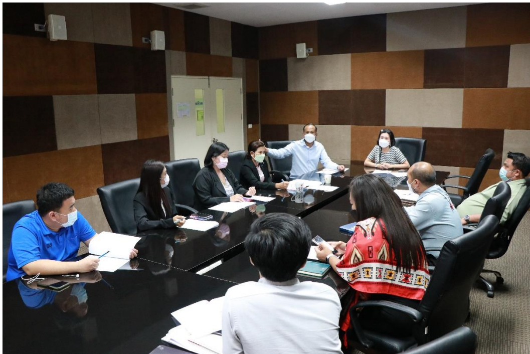
ภาพกิจกรรมการ ระยะเวลาที่ 2

ทบทวนแผน และจัดทำแผนปฏิบัติการประจำปีงบประมาณ พ.ศ. 2566